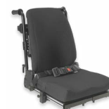
Rücken: ATC 2174, 2175