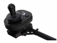
2231 / 2232