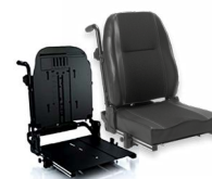
Rücken: ATC 2172 bzw. 2173