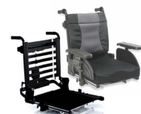
Rücken: ATC 2171